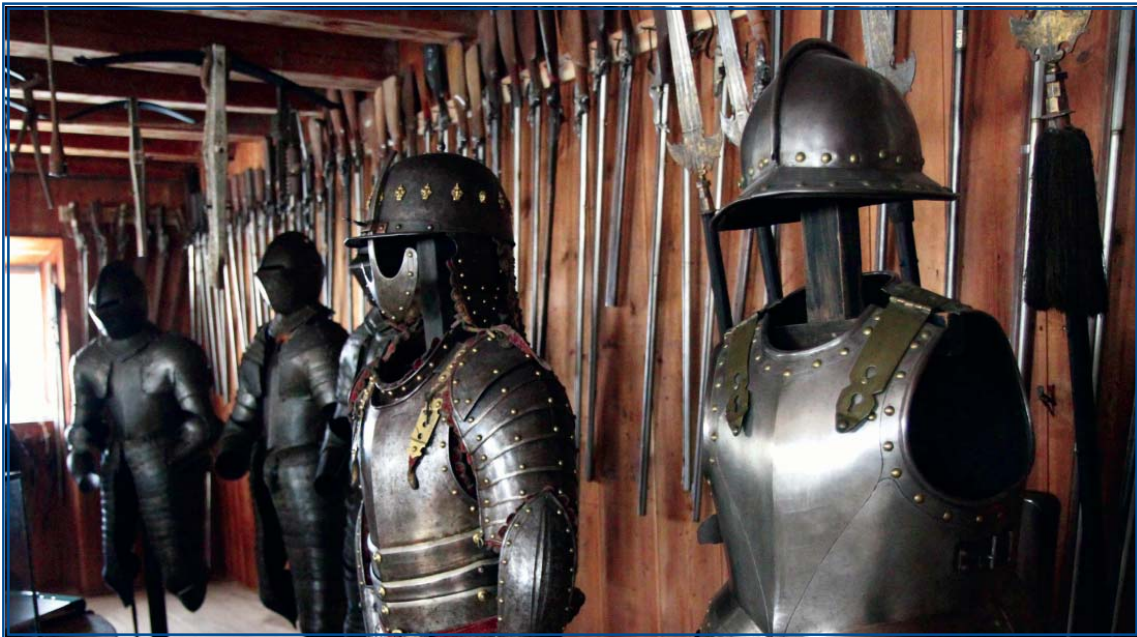
Näkymä Skoklosterin linnan asehuoneesta

Sigtunasta on vain 16 mailin Uppsalaan, jossa on nähtävää useaksi päiväksi. Jokea pitkin pääsisi vierassatamaan kaupungin keskustaan, mutta kääntösiltojen runsaus ja se, että vierassatamaa moititaan rauhattomaksi, saa meidät jäämään Skarholmenille. Sieltä on bussilla vartin matka nähtävyyksille.