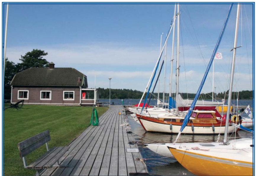
Uppsalan vierassatamaa isännöi Ekolns Segelklubben, jonka kerhorakennus on avoinna myös vierailijoille. Sauna lämpeä päivittäin.

Lisätietoa: Segla Mälaren (kirja), Upplev Mälaren (esite); molemmilla nettisivut, sekä www.malaren.com , www.malarslott.se , www.svenskagasthamnar.se (osa tiedosta myös suomeksi).