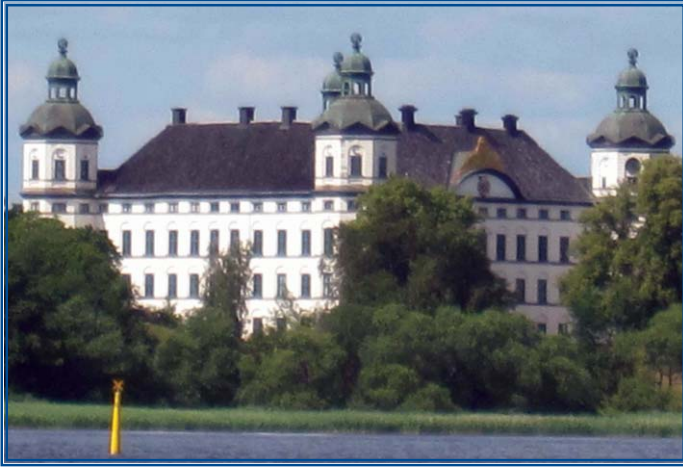
Skoklosterin linna on kuulunut Wrangel-, Brahe- ja von Essen-suvuille. Nyt se on museo; linnan vierassatama on viimeisen omistajaperheen pojan hallussa.

parhaiten säilyneessä barokkilinnassa, kannattaa käydä, vaikka linnakierros ei kaikkiin 80 huoneeseen ylläkään. Linnan vierassataman palvelurakennus oli heinäkuussa 2011 rakenteilla, muutamaa viikkoa myöhemmin se olisi ollut jo valmis.