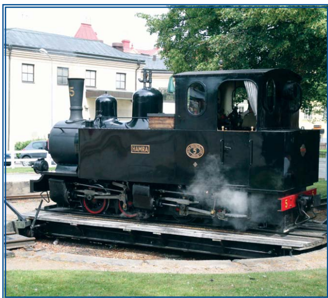
Suosittu Mariefredin museorautatie pyörii vapaaehtoisvoimin.

Heti Tukholman sydäimestä aukeava Mälaren on nähtävyyksistä kiinnostuneen ja etenkin historiaan hurautaneen veneilijän toivekohde. Siellä ovat seilanneet varhaiskeskiajan viikingit, ja sen rannoilla sijaitsevat Ruotsin suurvaltakauden muhkeimmat linnat. Pittoreskien pikkukaupunkien ostoskadut koettelevat shoppailijan itsehillintää, ja lukuisat venekerhot tarjoavat yöpymispaikkoja kohtuullisin hinnoin.