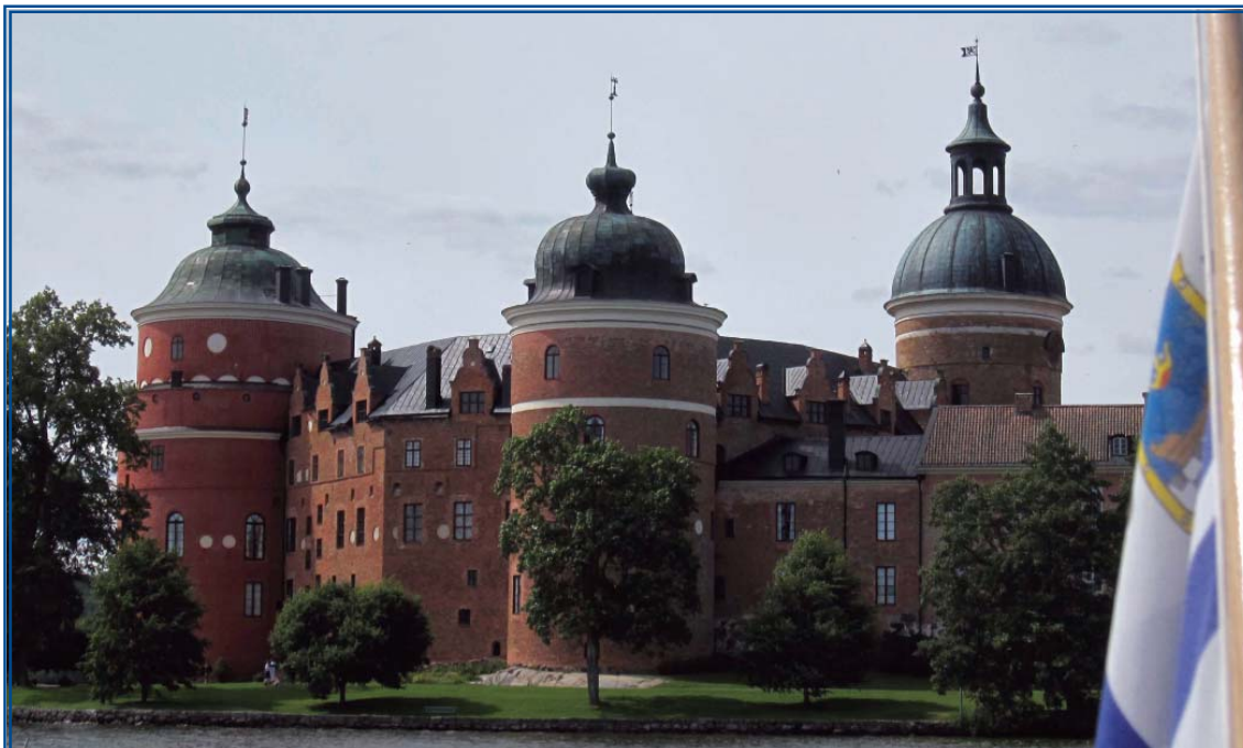
Mariefredin vierassatama on Kustaa Vaasan rakennuttamaa Gripsholmin linnaa vastapäätä.

Neljän viikon venelomalla – nopealla veneellä tietysti lyhyemmässäkin ajassa – ehtii hyvin Mälarenille. Siellä välimatkat ovat lyhyitä ja näkemistä riittää.